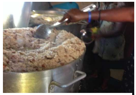
Une gamelle pour un repas