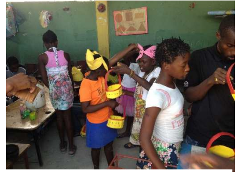
Travaux manuels pendant un camp d'été

Une fois la rentrée faite, les dépenses se poursuivront avec les frais de salaires des 30 enseignants, des repas servis aux enfants et jeunes inscrits dans les centres : 3500€/mois.