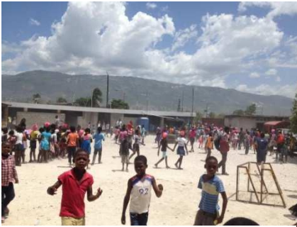
Jeux extérieurs pendant un camp d'été

Les 38 garçons de la Maisons Marcel Van sont maintenant répartis en 3 lieux, selon leur âge : à Delmas 31 pour les plus jeunes, chez Frandy au Village des Rapatriés pour les jeunes d'âge intermédiaire et, pour les plus âgés, dans l'ancienne maison de Pierre-Yvon, feu étudiant en droit, ami de Sœur Paësie et qui avait aidé lors de démarches d'adoption. Les 38 garçons sont tous scolarisés.