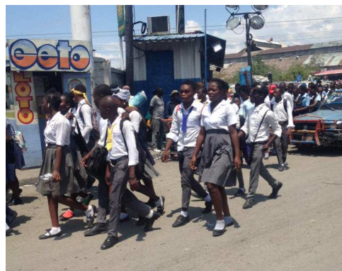
Marche pour la Paix par les jeunes

Ceci vient donc s'ajouter au quotidien de la Famille Kizito , des centaines de personnes en situation critique à soutenir, nourrir en urgence, à qui donner de l'eau, à aider pour payer des