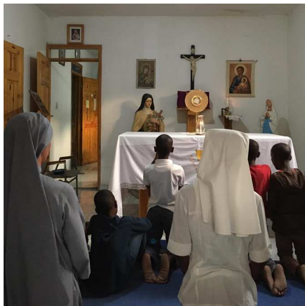
Prière d'adoration à la Maison Marcel Van

« Au catéchisme, les enfants de Cité Soleil apprennent que le Carême est un temps de Pénitence qui dure 40 jours parce que Jésus a fait pénitence dans le désert pendant 40 jours pour rencontrer son Père et qu'il y a été tenté, pour nous rappeler que notre âme doit peu à peu "envelopper" notre corps. Ils apprennent aussi que le peuple juif, après sa libération d'Egypte et sa traversée de la Mer Rouge à pied sec, a "tourné en rond" dans le désert pendant 40 ans, pour s'y laisser purifier par l'incertitude, la faim et la vie "au jour le jour", apprenant la confiance en suivant la colonne de nuée. Tout cela semble tout à fait normal aux enfants de Cité Soleil car leur vie y ressemble : pénitence, incertitude, faim, vie "au jour le jour". Les enfants sont lucides : ils savent que la vie sur terre est un désert, ils expérimentent que "la vraie Vie