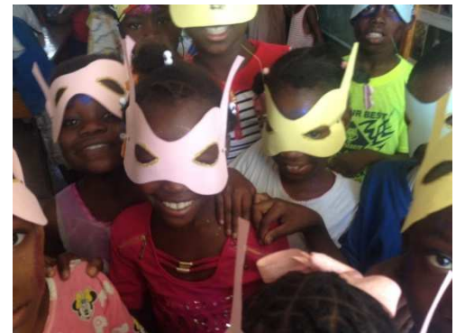
Carnaval avec Jésus

Au total, 500 enfants sont catéchisés à l'heure actuelle par la Famille Kizito !