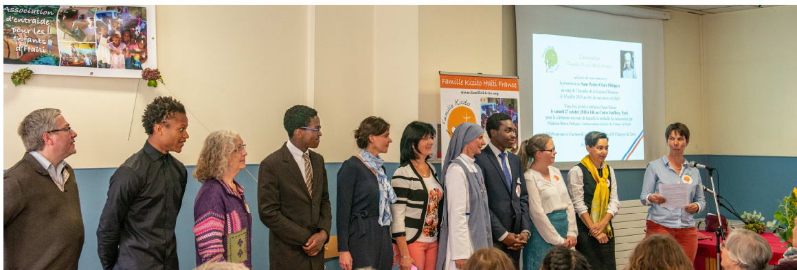
Le Conseil d'Administration, de gauche à droite :

Impression : par nos soins