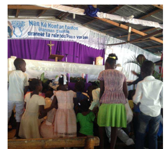
Enfants devant la couronne de l'Avent

Je vous embrasse tous. Merci pour vos prières. » Sœur Paësie