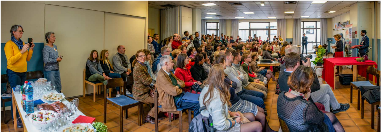
Durant la cérémonie de remise de la Légion d'Honneur