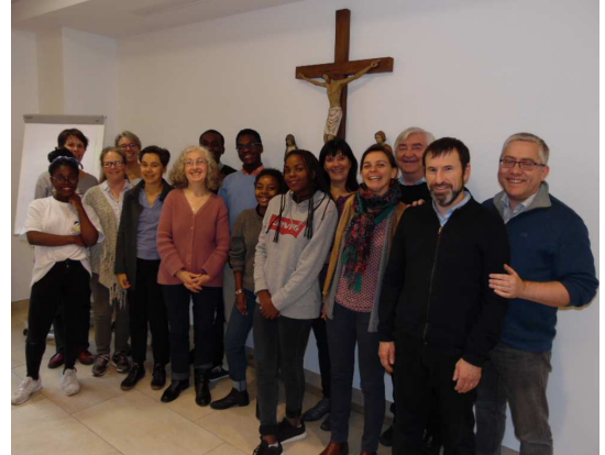
Les premiers membres de l'association

Nous avons fait le choix de fixer un montant de cotisation individuelle réduit afin de permettre aux plus grand nombre d'adhérer et de soutenir l'œuvre.