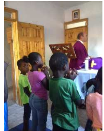
Messe avec le Père David