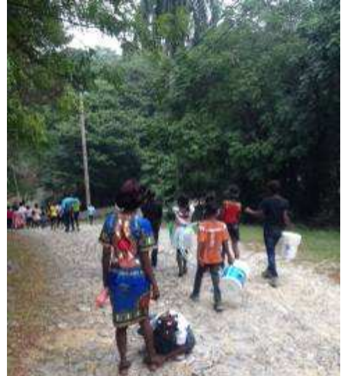
Promenade dans la campagne

Un prédicateur connu et apprécié prêcha pendant cette neuvaine, il dénonça la corruption du gouvernement ... le 23 décembre on a appris qu'il a été assassiné.