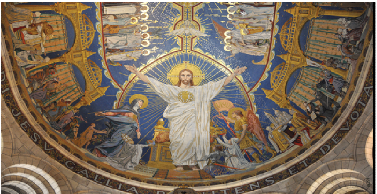
Mosaïque au Sacré-Cœur de Montmartre

Un des fondements de l'Association est de nous laisser guider par Dieu. C'est pourquoi, nous vous transmettons la prière de la Famille Kizito . Chaque membre de la Famille Kizito est invité à la dire quotidiennement en communion avec les membres d'Haïti à midi et ou 18h, heure française.