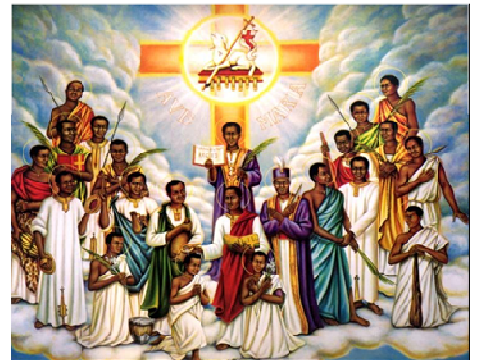
Les saints martyrs de l'Ouganda

Les autres saints patrons choisis sont : Notre-Dame du Perpétuel Secours (patronne d'Haïti), Saint Charles Lwanga et ses compagnons martyrs d'Ouganda, les martyrs d'Haïti, Bienheureux Pierre Toussaint (un haïtien), Marcel Van (martyr vietnamien et apôtre de la pureté et de l'amour), Sainte Thérèse de l'Enfant-Jésus, Saint Louis-Marie Grignon de Montfort.