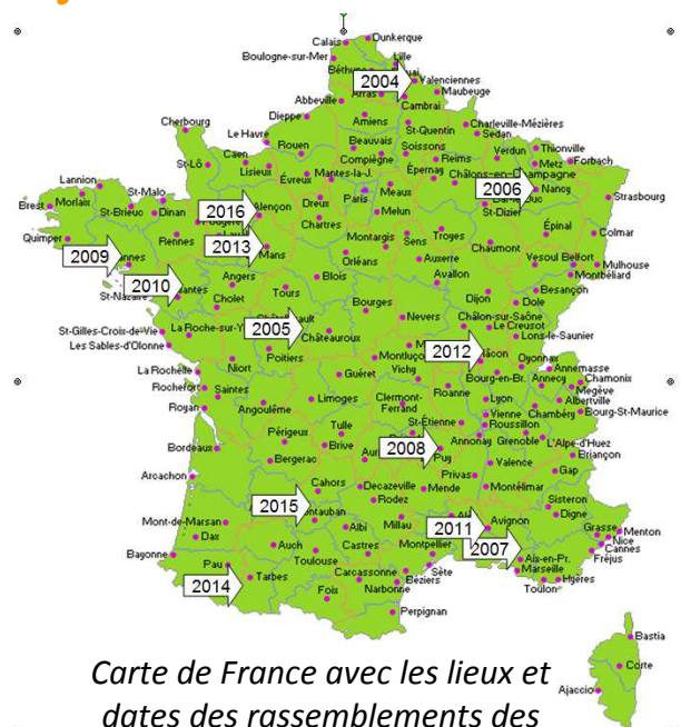
Carte de France avec les lieux et dates des rassemblements des familles adoptives

A partir de 2004, les familles volontaires se retrouvent et vont, d'année en année, faire le tour de France en se retrouvant au printemps, le temps d'un