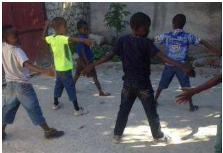
Cours de danse

L'objectif de ces activités est d'épanouir ces enfants et ces jeunes, en leur proposant autre chose que la corruption dès leur plus tendre enfance, et de leur offrir une autre issue que les gangs ou la prostitution pour avoir un peu d'argent et à manger en brisant le cercle vicieux inéluctable de ce quartier. Ceci pour mettre en œuvre cette parole de Jésus : «Quiconque accueille un petit enfant tel que lui à cause de mon nom, c'est moi qu'il accueille. Mais si quelqu'un doit scandaliser l'un de ces petits qui croient en moi, il serait préférable pour lui de se voir suspendre autour du cou une de ces meules que tournent les ânes et d'être englouti en pleine mer.» Mt XVIII, 5-6.